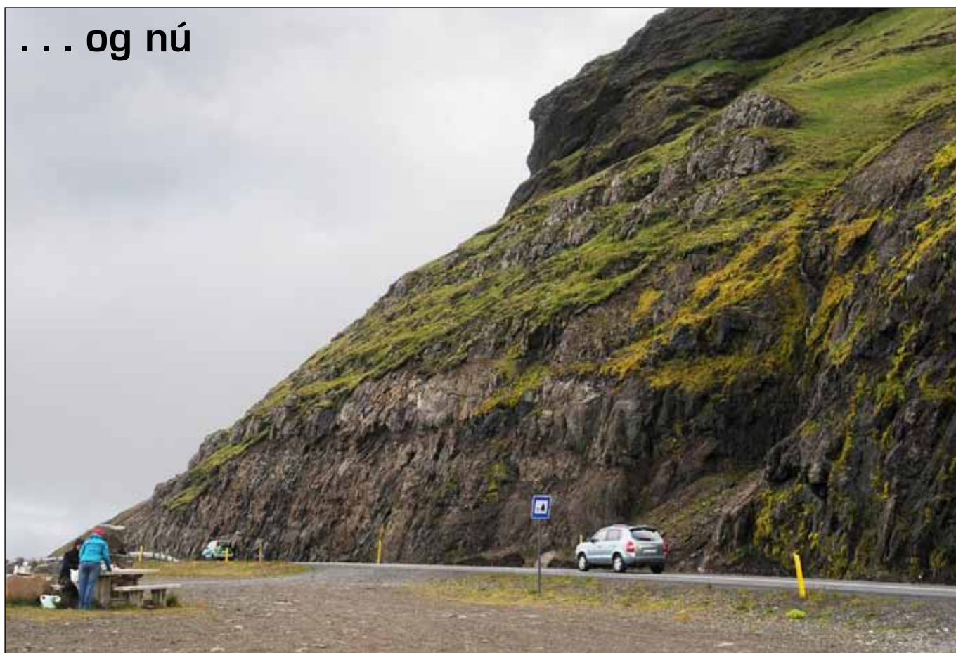
Búlandshöfði á Snæfellsnesi árin 1944 og 2013. Klettarnir efst til hægri á gömlu myndinni eru greinilega þeir sömu og fyrir miðri mynd á nýju myndinni. Þessi gamla hestaslóð lá í miklum bratta og var mjög vandfarin. Bílvegur var fyrst lagður þarna árið 1962 en vegurinn svo lagður í núverandi mynd árið 1999. Við þessa vegagerð var skriðunum sem sjást á gömlu myndinni ýtt niður fyrir.