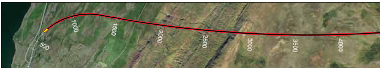
Vaðlaheiddargöng, staða framkvæmda 15. júlí 2013, Búið er að sprengja 60 m frá Eyjafirði sem er 1% af heildarlengd.