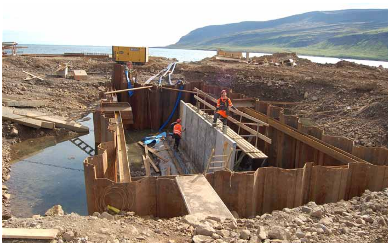
Brú yfir Kjálkafjörð, unnið við millistöpul. 24. júní 2013.